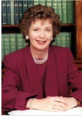
Mary Robinson