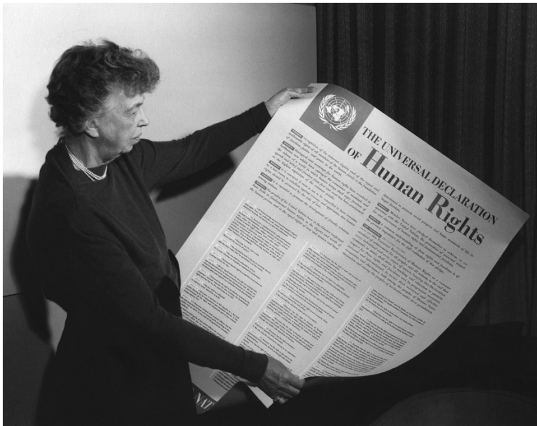
Eleanor Roosevelt holding poster of the

Aber so benachteiligt die Frauen auch waren und so spät man entdeckte, dass sie gleichberechtigt Rechte haben müssten, so ist es doch der Name einer Frau, der mit dem wichtigsten Dokument der Menschenrechtsgeschichte verbunden ist: Eleanor Roosevelt. Präsident Truman hatte sie zur US-Delegierten bei den neu gegründeten Vereinten Nationen ernannt; von der zur Ausarbeitung der Menschenrechtserklärung eingesetzten achtzehnköpfigen Kommission wurde sie daraufhin zur Vorsitzenden gewählt. Es gelang ihr, das Projekt als „Madame Chairman“ mit diplomatischem Geschick und Fingerspitzengefühl, vorbei an unendlich vielen Klippen und Sensibilitäten, zu einem erfolgreichen Ende zu führen. 23