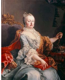
Portrait of Maria Theresia by Martin van Meytens, 1759.

Denn auch wenn im 18. Jahrhundert Frauen das politische Geschehen in Europa dominierten – man denke an Katharina II in Russland und Kaiserin Maria Theresia in Österreich – gab es doch noch keine Rechtsberaterinnen oder Advokatinnen. Das Recht schien nicht für die Frauen oder die Frauen nicht für das Recht gemacht zu sein. Die Macht konnte ihnen in die Hände fallen, sei es durch Geburt, sei es durch Heirat. Aber das sachliche Argumentieren wollte man ihnen nicht überlassen.