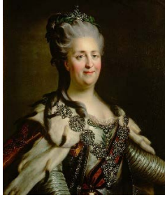
Katharina II, Nachahmer von Johann Baptist von Lampi-Kunsthistorisches Museum