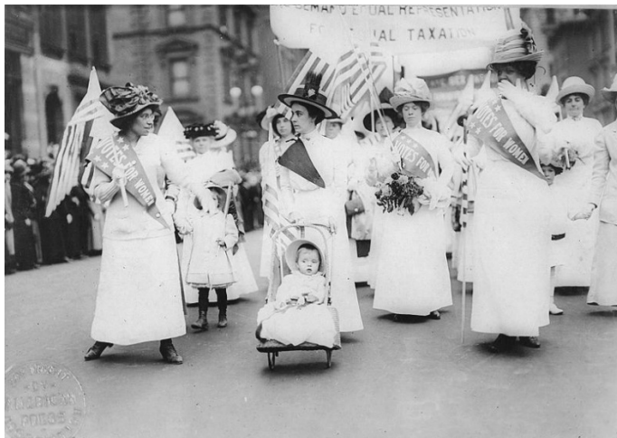
Feminist Suffrage Parade in New York City, 1912, Wikimedia,

Mehr unmittelbaren Nachhall im Kampf um politische Partizipation und Gleichberechtigung für Frauen hatte die Bewegung der Suffragetten ein Jahrhundert später.